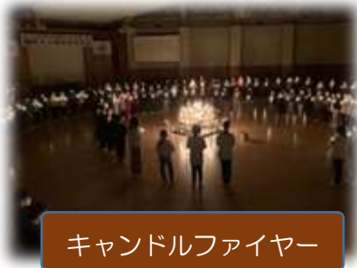
キャンドルファイヤー

さいたま市中央区上落合4-14-24 TEL852-5381 FAX852-0150 http://kamiochiai-e.saitama-city.ed.jp / E-mail:kamiochiai-e@saitama-city.ed.jp