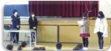
教室終了後、お礼を述べる代表児童