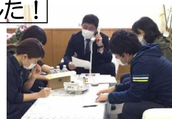
本番前 最後のリハ 実は緊張してます

5月22日（金）【REDS WAVE 87.3 FM】「家庭で過ごす君たちへ 先生からのメッセージ」で本校「かみおちラジオ第2弾」が放送されました。メインパーソナリティーの先生方のトークも軽快に、大変ご好評をいただきました。インターネット等で、聴くこともできます。聴き逃された方は、ぜひどうぞ！