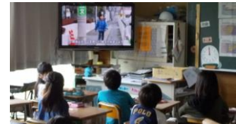
3年生「交通安全教室」授業風景 「危ない！」道を歩いている男子のの前に、この後、急に車が飛び出してきました。