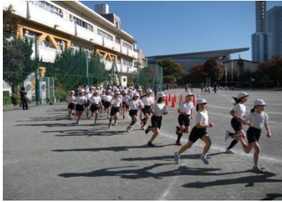
元気に走りぬく子どもたち