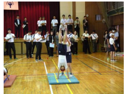
150名を超える先生方の前での公開授業

しかし、まだまだ改善すべき点は多々あり、研究協議でいただいたたくさんの貴重な意見や考えをぜひ今後生かしていきたいと考えています。