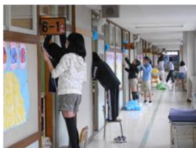
【1年生の教室飾り付け】

4月2日（水）に新6年生が、新年度の教室等を準備するためにお手伝いに来てくれました。机やいすの移動、新1年生の教室の飾り付けなど、友達と協力しながら一生懸命働いてくれました。また、あいさつをかわす表情もいきいきとしていました。その姿には、上落合小の最高学年としての自覚と自信が感じられ、大変心強く思いました。まさに『あかるく なかよく たくましく』を実践しているようでした。そのような新6年生を見ると、他学年の児童のよさも目に浮かぶようです。新1年生をはじめ、これからたくさんの方と触れ合うことがとても楽しみになってきました。一年間よろしくお祈りいたします。