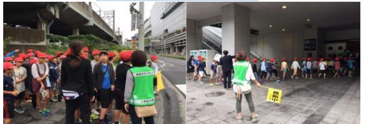
午前・午後の子供たちのスーパーアリーナへの往復移動時には、環境安全委員会が立哨を担当しました。事故なく移動することができました。