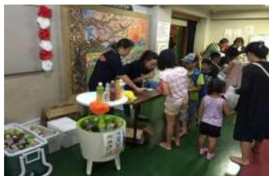
PTA有志による屋台もあり、盛り上がりました。

子供たちに夏休みの思い出をもう1つ作ってもらおうと、納涼映画会を開催しました。台風の影響で、会場が校庭から体育館へ変更になったのは残念でした。