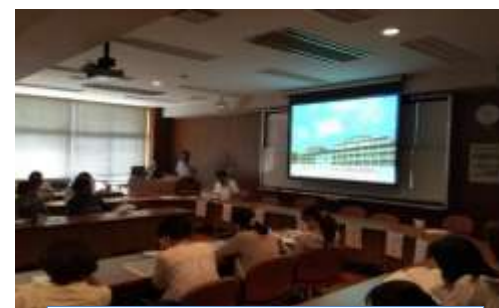
大会議室での学校説明