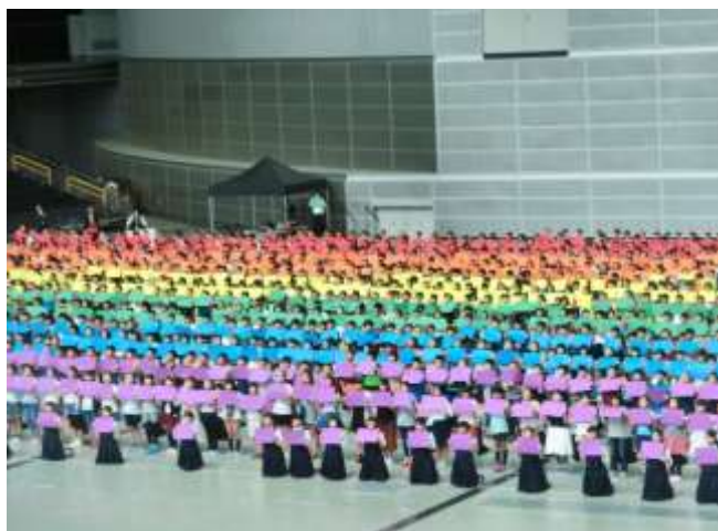
上落合小・下落合小・与野東中の児童生徒で作った虹

海上自衛隊東京音楽隊による記念演奏会では、「さんぽ」や「宇宙戦艦ヤマト」「ポギー大佐」など、誰もが1度は耳にしたことのある曲目ばかりで、子供から大人まで楽しめるプログラムでした。地域の方や保護者も多く参加し、とても素敵な時間を共有できました。