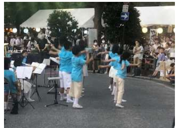
途中では楽しいダンスも