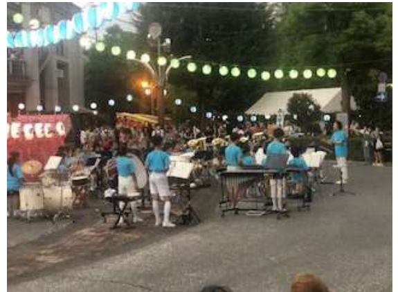
演奏が始まりました

まだまだ暑い日が続きます。まずは、熱中症予防に最大限の注意を払ってまいります。一人ひとりの健康観察を十分に行い、特に屋外の活動においては、暑熱順化(体を暑さに徐々に慣らしていくこと)を取り入れた無理のない活動を行ってまいります。さらに、暑い日の室内外での過ごし方やこまめな水分補給等についても、学校で重点的に指導してまいります。ご家庭でも折に触れてご指導いただきますようお願いいたします。